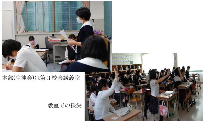
本部(生徒会)は第3校舎講義室

本年度生徒総会は新型コロナウイルス防止から、生徒は各クラスでの参加となりました。教室設置のテレビ画面を使用し、新しい形の生徒総会になりました。